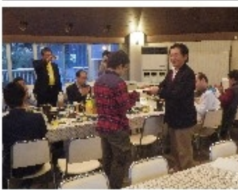
くたくさんのことを教え

高年生になり、昨年9月のいえしま自然体感塾というキャンプにスタッフとして参加することになりました。今までは参加者だった私がスタッフとしてどんな仕事ができるのか、何をしたらいいのか、不安もたくさんありましたが、周りのスタッフの人たちが解りやすくたくさんのことを教え