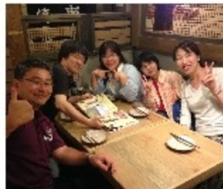
6月21日(土)神奈川・武蔵小杉の居酒屋に東京近郊在住会員5名が親睦

を目的として集いました。出席会員から「兵庫県下の事業にはなかなか参加できないがリレー・フォー・ライフ(RFL)活動であれば、東京近郊でもできることがあるのではないかと提案があり、9月20日(土)〜21日(日)開催予定のRFL横浜都筑に協力していくことになりました。7