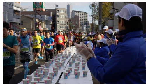
2017年 神戸マラソン写真より

団体ボランティアの人数60名を15人、ひと組として当日グループ分けをいたします。 各、組に1名のボランティアリーダーとメンバー14名（15名のグループ）での活動となります。