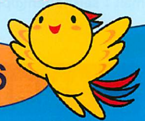
兵庫県マスコットはばタン

ひょうごユースケアネット推進会議・兵庫ひきこもり相談支援センター連絡協議会第3回研修会 ころ豊かな人づくり500人委員育成事業全県セミナー