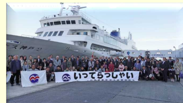
50周年記念式典 2022年11月6日