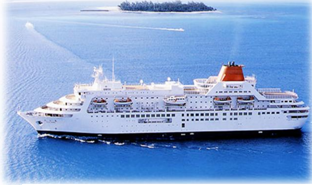
大型外航クルーズ客船「ふじ丸」総トン数23,235t 定員600名