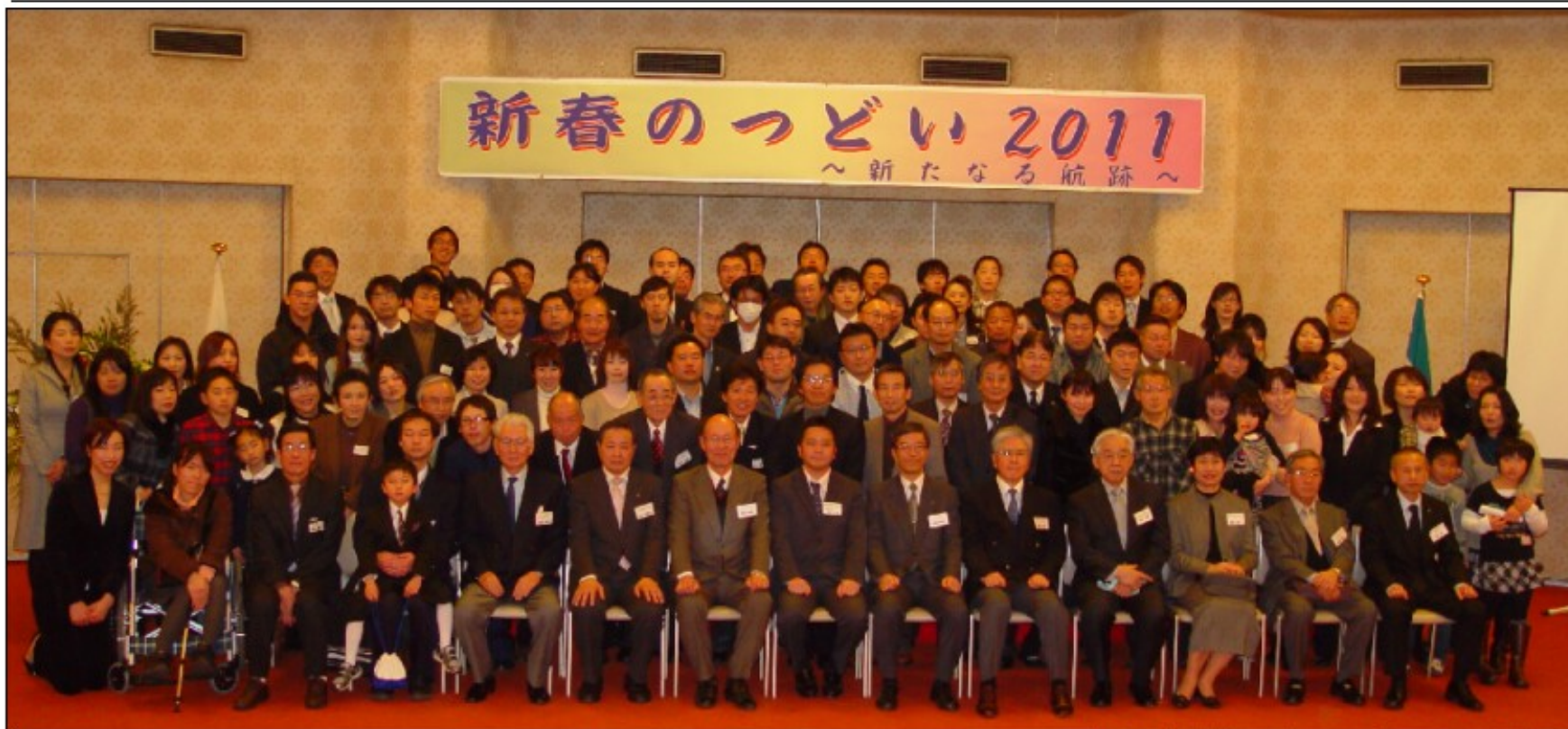
新春のつどい 2011 ～新たなる航跡～

発行所：兵庫県青年洋上大学同窓会 神戸市中央区下山手通4-16-3 兵庫県民会館7階 TEL & FAX：078-891-7419 (火曜日19時～21時以外は留守番電話) info@hyogo.yodai.net アドレス：http://hyogo.yodai.net/ 発行人：藤本 佳幸 編集人：赤松 浩一