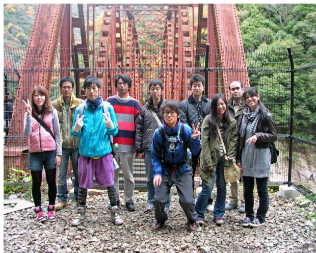
2009年11月29日武庫川廃線ハイキング

阪神地区では自然に親しみながら、地域の青年との交流を図るために、ハイキングの活動に取り組んでいます。