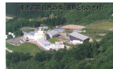
ベースキャンプ地