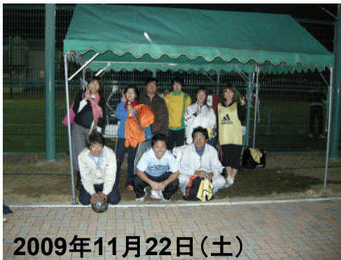
2009年11月22日(土) 垂水スポーツガーデンにて