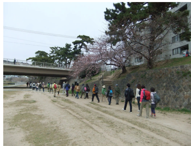
2011年4月3日夙川緑道ハイキング