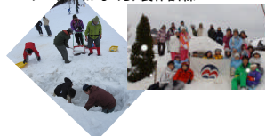
雪中行軍訓練(スキー・スノーボード)