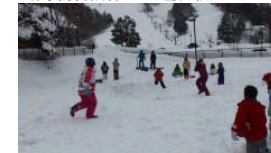
奇襲攻撃防御訓練