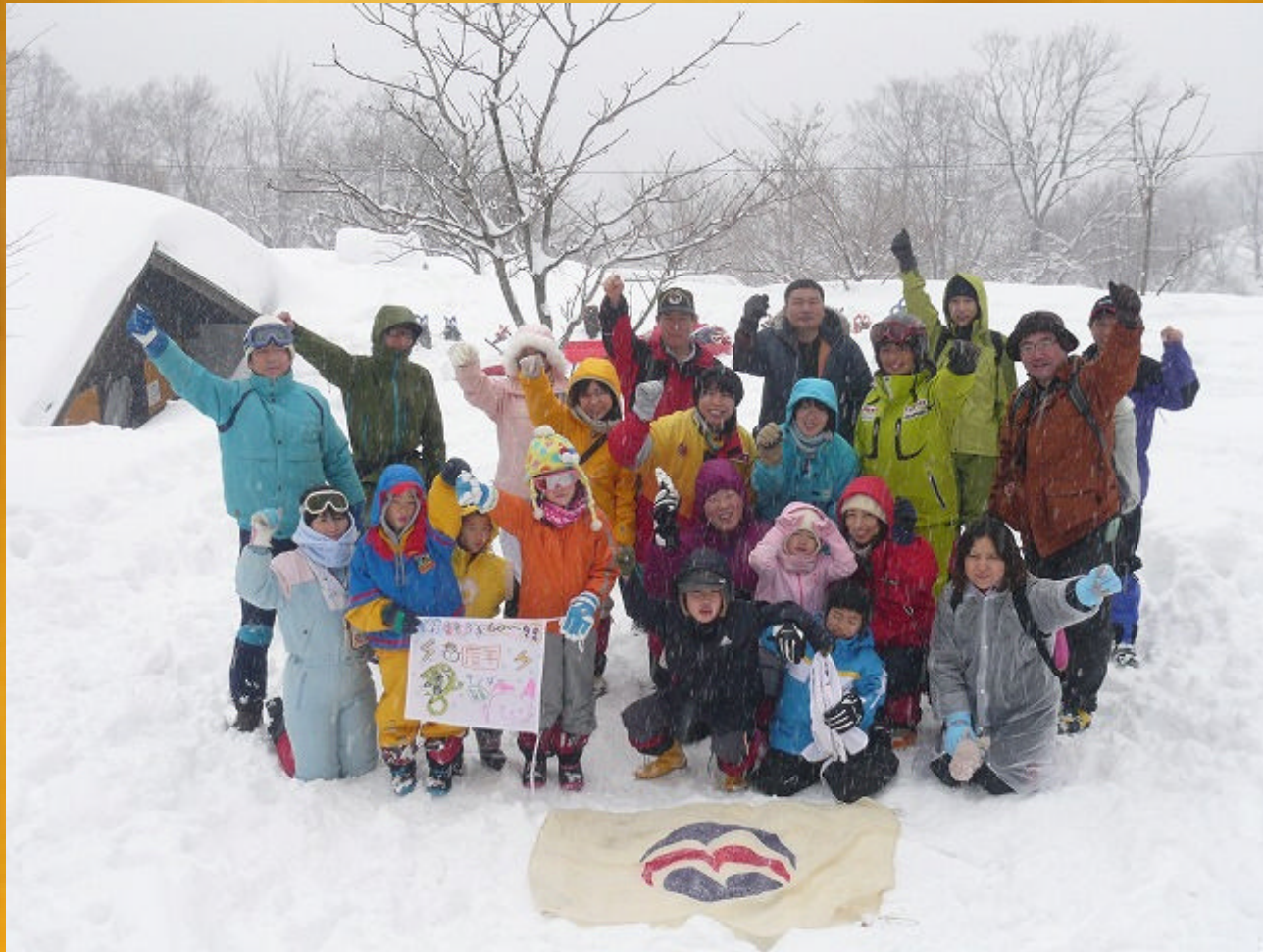
2012年 ぼくらは雪山探検隊 隊員一同