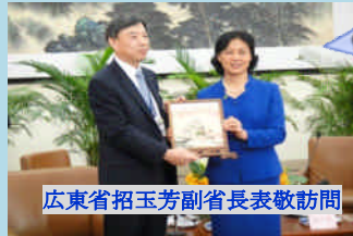
広東省招玉芳副省长表敬訪問