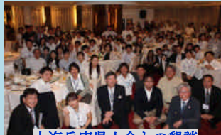
上海兵庫県人会との懇談