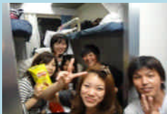
広州→上海 寝台列車