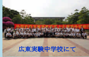
広東実験中学校にて