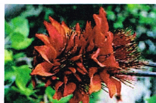
沖縄県の花 デイゴ