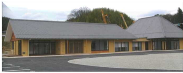
ベースキャンプの上おおぞうふれあい会館