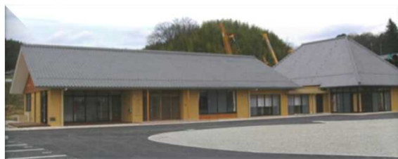
ベースキャンプの上おおぞうふれあい会館