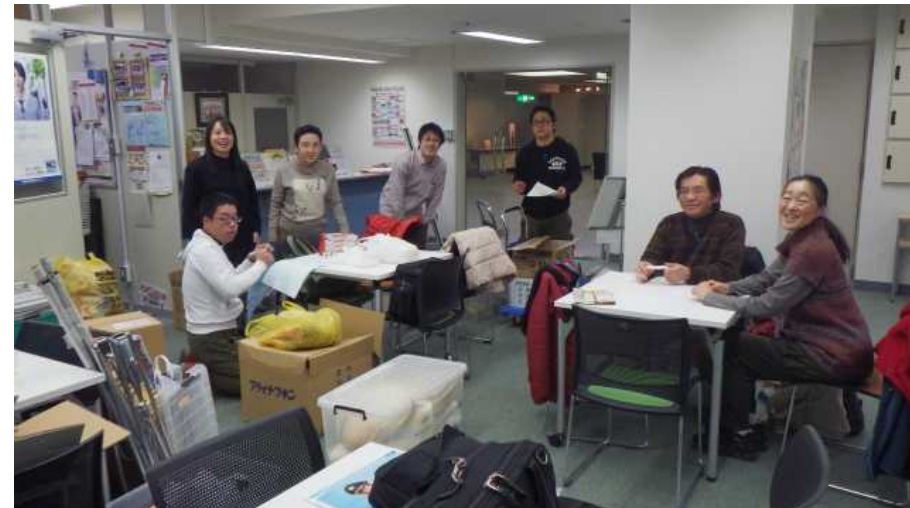
実行はしなやかに