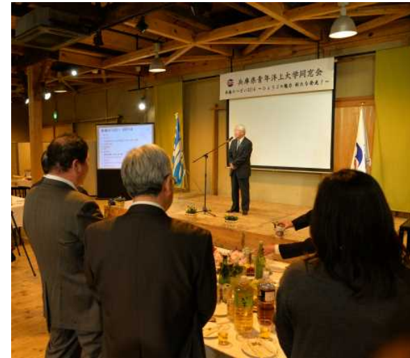
井戸敏三(同窓会名誉会長)兵庫県知事よりご挨拶 乾杯のご発声も頂きました