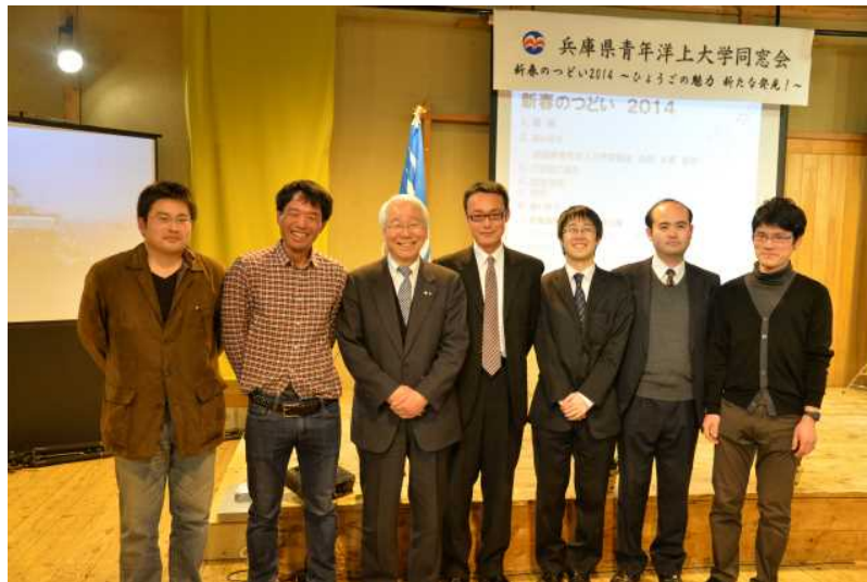
海外養成塾生やサポーターと名誉会長