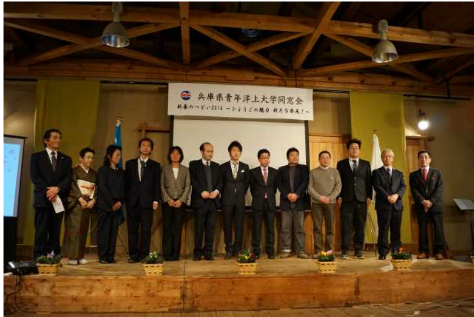
洋上大学同窓会役員(地区代表者)と顧問