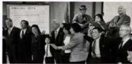
実施を経て、平成20年には隔年実施となり、23年度からは名称を変えている。

飛行機を利用した「海外養成塾」として行われていた。同窓会は昭和47年に結成され、同大学の成果と学生間のネットワークを生かした社会貢献、地域活動を行っている。