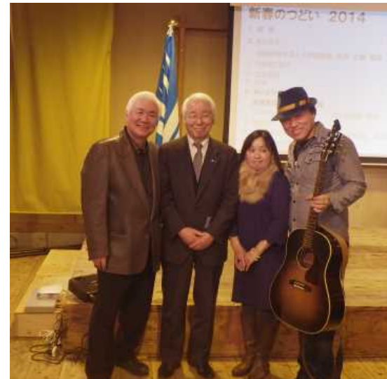
洋大おやじバンドと名誉会長