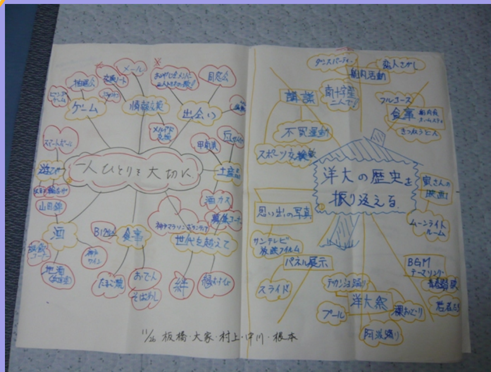
1/26 板橋 大家 村上 中川 根本