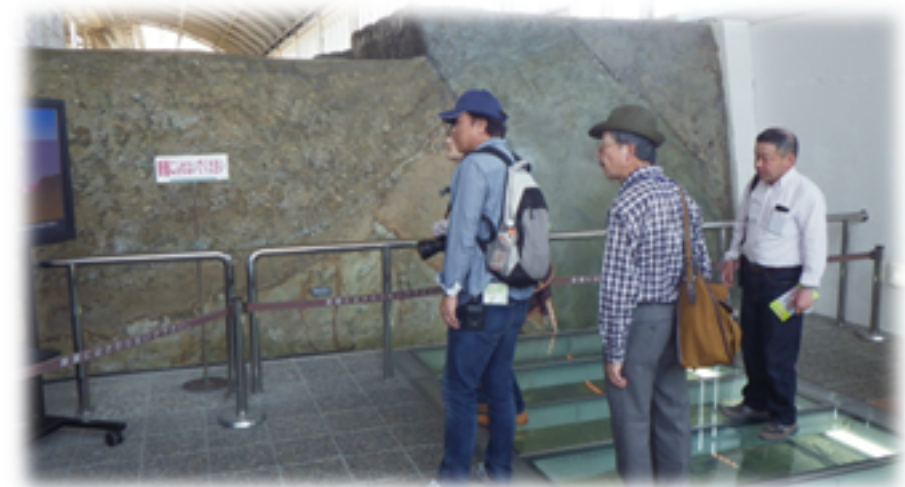
野島断層保存館⇒メモリアルハウス⇒震災体験館