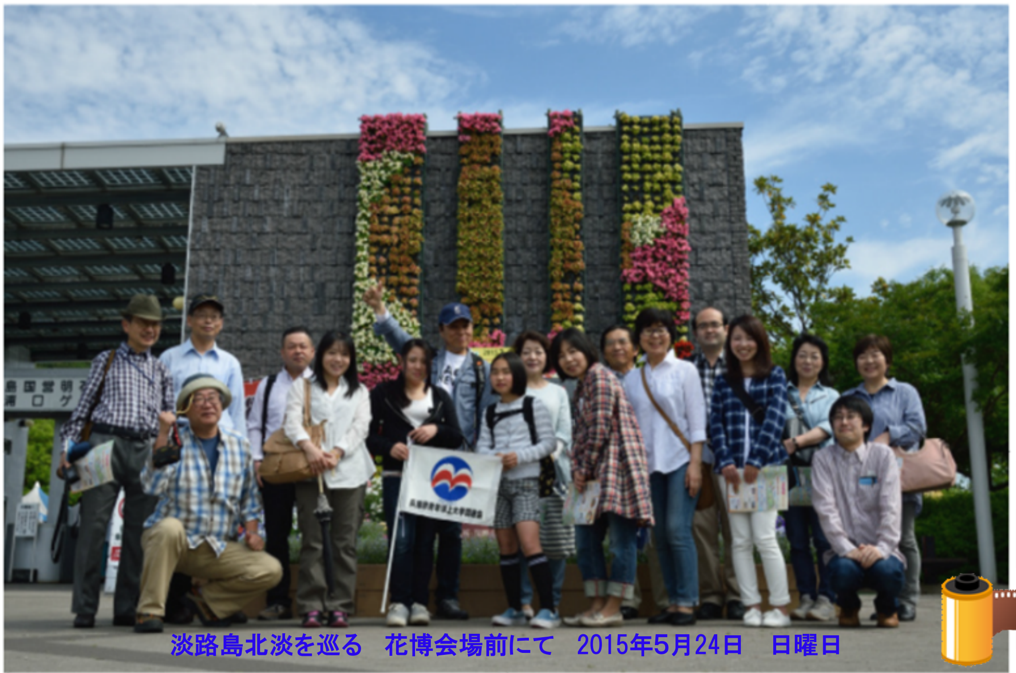
淡路島北淡を巡る 花博会場前にて 2015年5月24日 日曜日