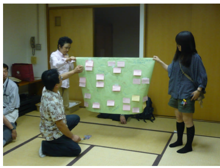
ワークショップ発表