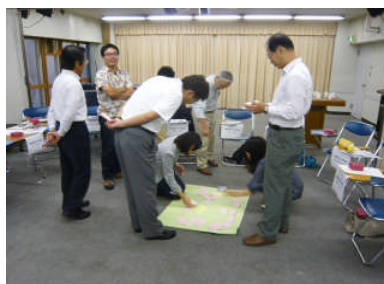
ワークショップ作業中