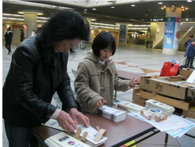
同窓会のテーマは「ボードゲームを体感しよう」