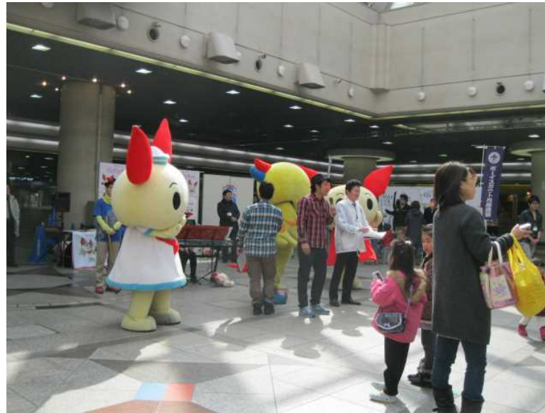
会場のステージには「はばたん」「けんけつちゃん」も参加しました