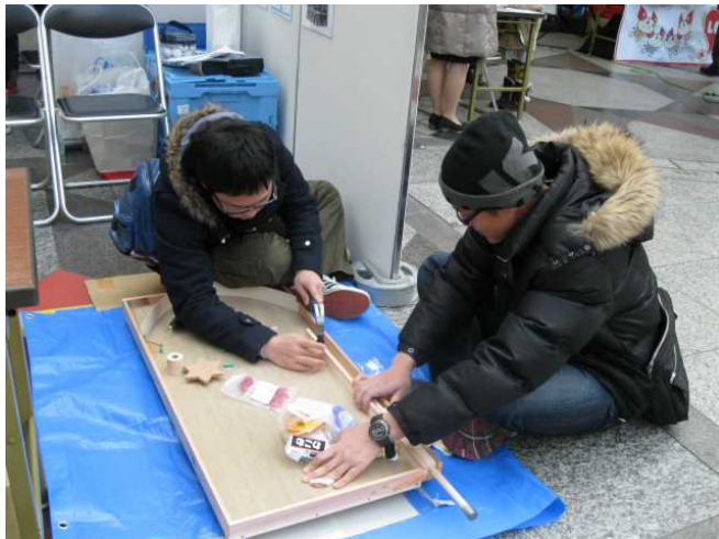
スマートボールを体感する