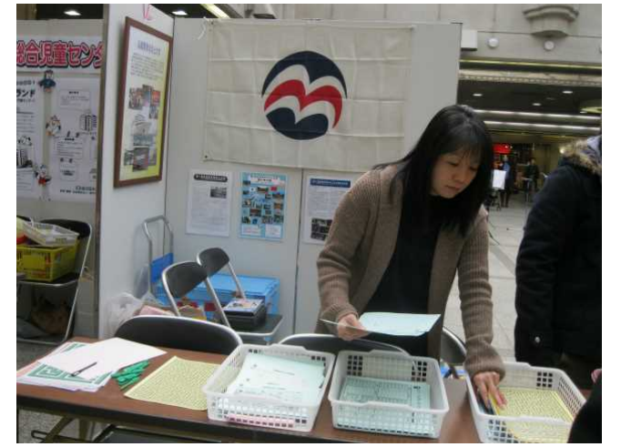
迷路も準備しています