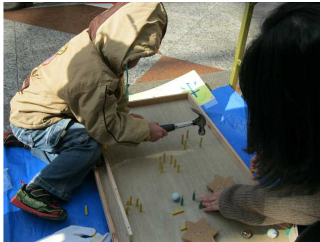
受付後、スマートボール作りへ