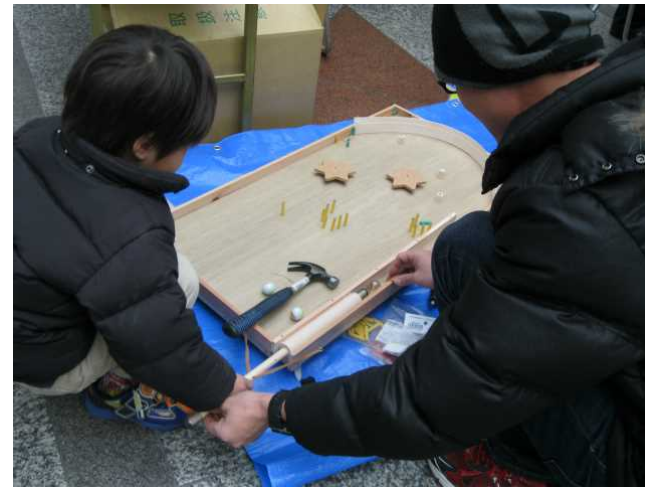
参加者で作って遊ぼう