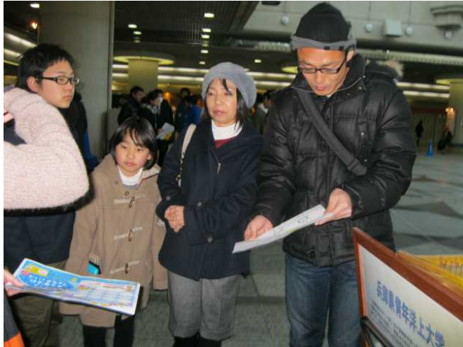
2月23日 JR神戸デュオドーム集合